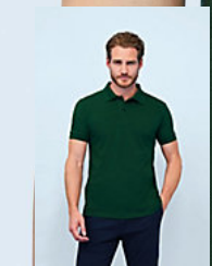
SOL'S PERFECT MEN 11346