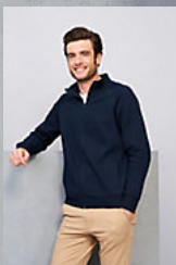
SOL'S SUNDAE 47200