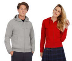
B&C Hooded Full Zip /men & /women