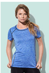
ST8940 Recycled Sports-T Reflect