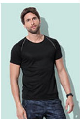
ST8030 Active 140 Team Raglan